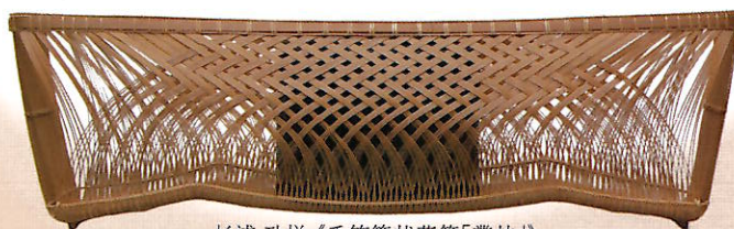
杉浦 功悦《千筋簾状花籃「叢林」》