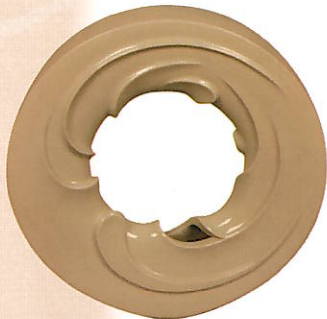
待田 和宏《シリウスの滴》

大量生産品があふれる画一的な日常の中で、私たちが手しごとのかたちに心を惹きつけられるのは、真摯に素材に向き合い、その味わい、深みを制作へと高めていく、ものづくりの価値を、民藝や工芸という言葉の壁や、時代を超えて受け継がれた本能として知っているからなのかもしれません。それぞれの地域の暮らしや自然・風土に根差して変化する民藝が追い求めたかたちから、作家が追い求めたかたちまで、様々なかたちを通して手しごとの世界を心ゆくまでごゆっくりとご鑑賞ください。