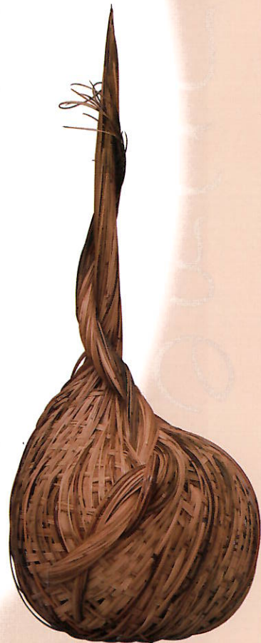
天野 育代《芽吹の時》