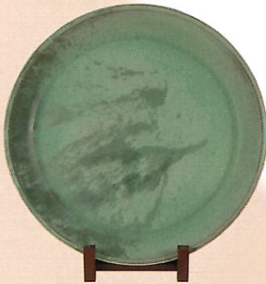
平尾 陶元《流れる空翠の時》