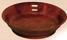
小林 健次《榉拭漆鉢》