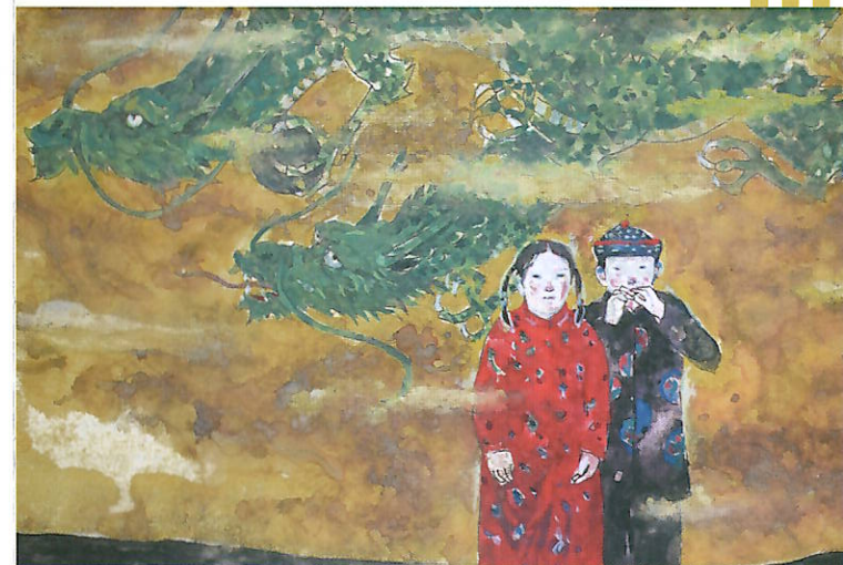
2019年度 新収蔵作品 森脇正人《探し》(作品部分)