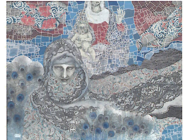
2021年度 新収蔵作品 北設楽少彦《刺青考》