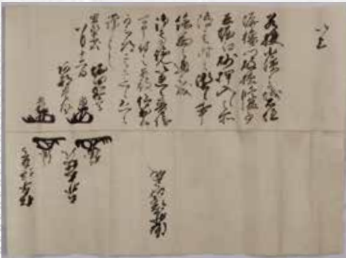
寛永11年8月12日 江戸幕府老中連署奉書(小浜市蔵 酒井家文庫)