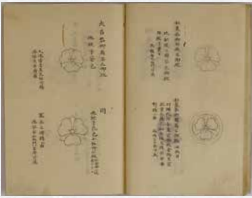
諸御紋古形之事「姫陽秘鑑」十五 所収(姫路市立城郭研究室蔵)