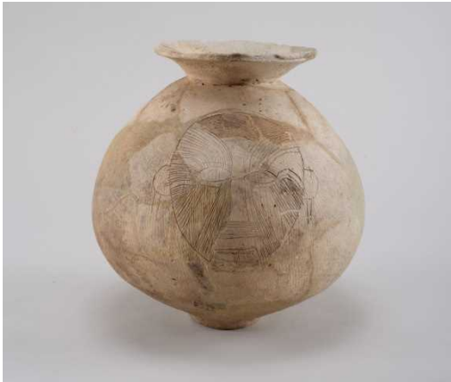
じんめんもんつぼがたどき 人面文壺形土器